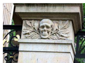
vstup na Slavín