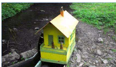
vykuk čert (více v přiloženém videu)