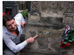
náhrobek s nápisem