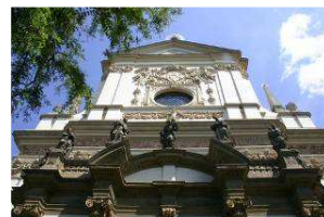
kostel sv. Ignáce