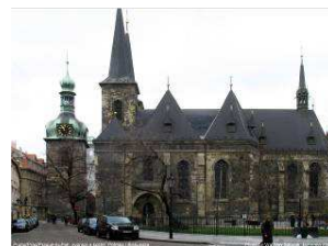
kostel sv. Petra na Petrově