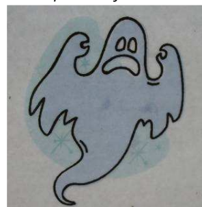
povzbudivý pozdrav od doc. Duchu