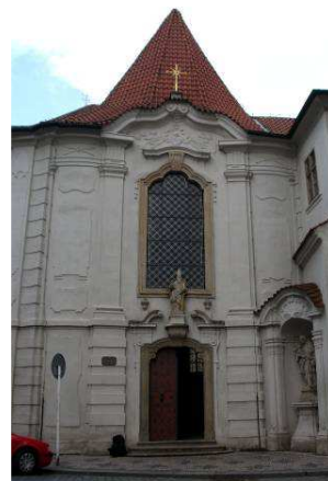
kostel sv. Vojtěcha