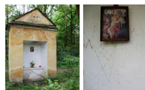
Panenko Marie z kapličky a vzkaz pod ní