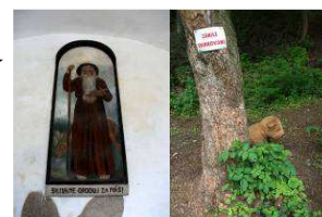
sv. Ivan a zvíře

To je proklatě dlouhá vesnice bez konce. Kostel na návsi má hezké chrliče. Dominantním úkazem ve vesnici se nám stala drobná to stará žena, která vezla prázdné kolečko. Nebylo by na tom nic zvláštního, kdyby v kolečku neměla naložená vlastní prsa, ufff.