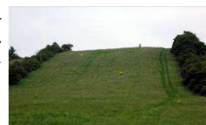
menhir nad Mořinkou