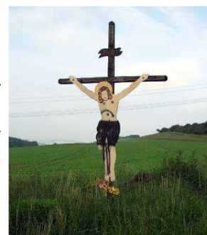
Kristus na kříži