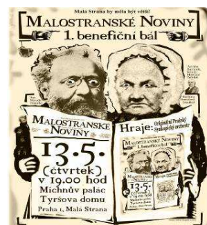
Nerudovi - matka a syn