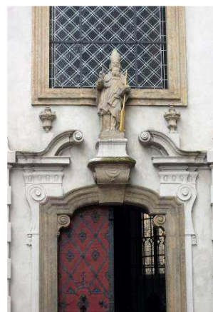
socha sv. Vojtěcha na kostele