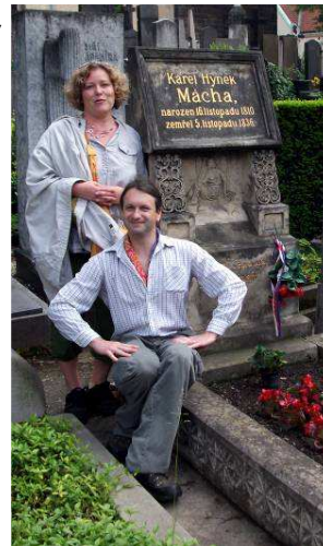
poslední Černá dimenze