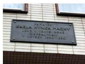
Máchův dům na Karlově nám.