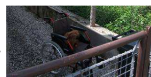
jezevčík na invalidním vozíku