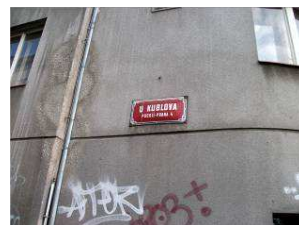
neuvěřitelné zrychlení (pro nezasvěcené- Kublov je vesnice 5 km od Točnicku)