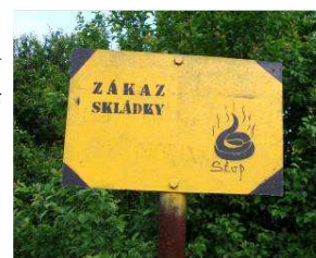
skládka s voňavým hovinkem