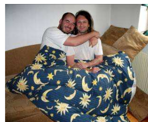
chlápci v akci