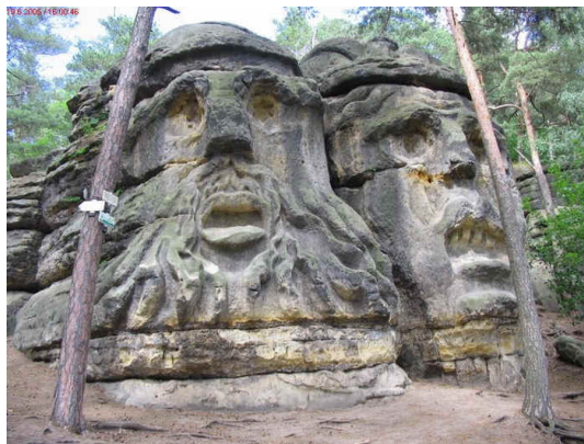
Obří hlavy 9m výšky