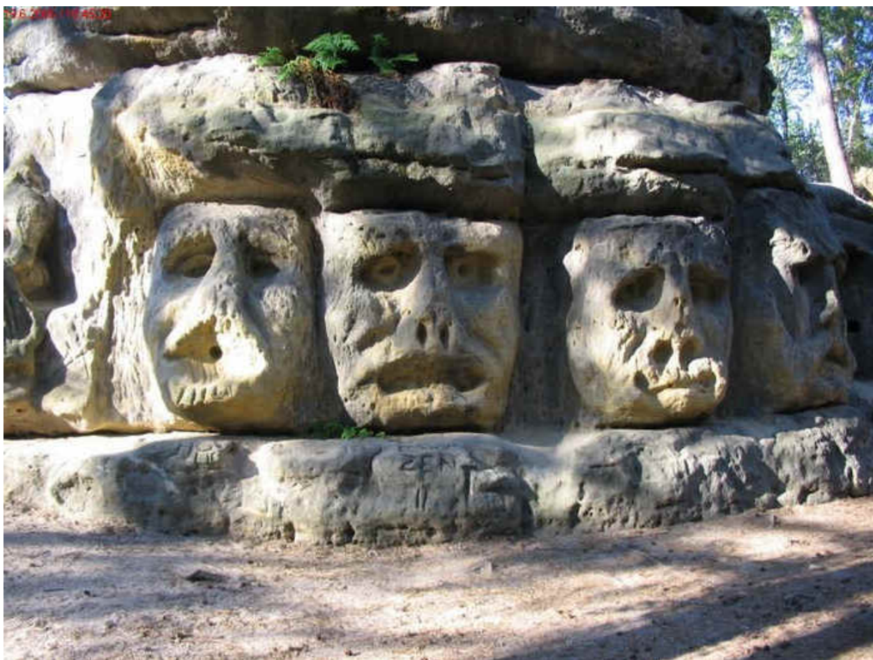
Čtyři čertovské hlavy

Když majitel liběchovského zámku odhalil, kam se mu „zabíhá“ kuchařský pomocník, poslal ho hned na studia do Německa. První jeho kamenický učitel prohlásil, že ho nemá čemu učit. Po návratu nenašel moc práce, přesto stihl vyzdobit zámky Liběchov, Zákupy a Ploskovice. Poté odjel Levý do Říma a tady se proslavil.