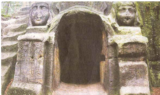
jeskyňka u Harfenice inspirovaná Egyptem

postavy české minulosti (Žižka, Holý, Jan Zásmucký) a velké sochy. Podívejme se na některé z nich: