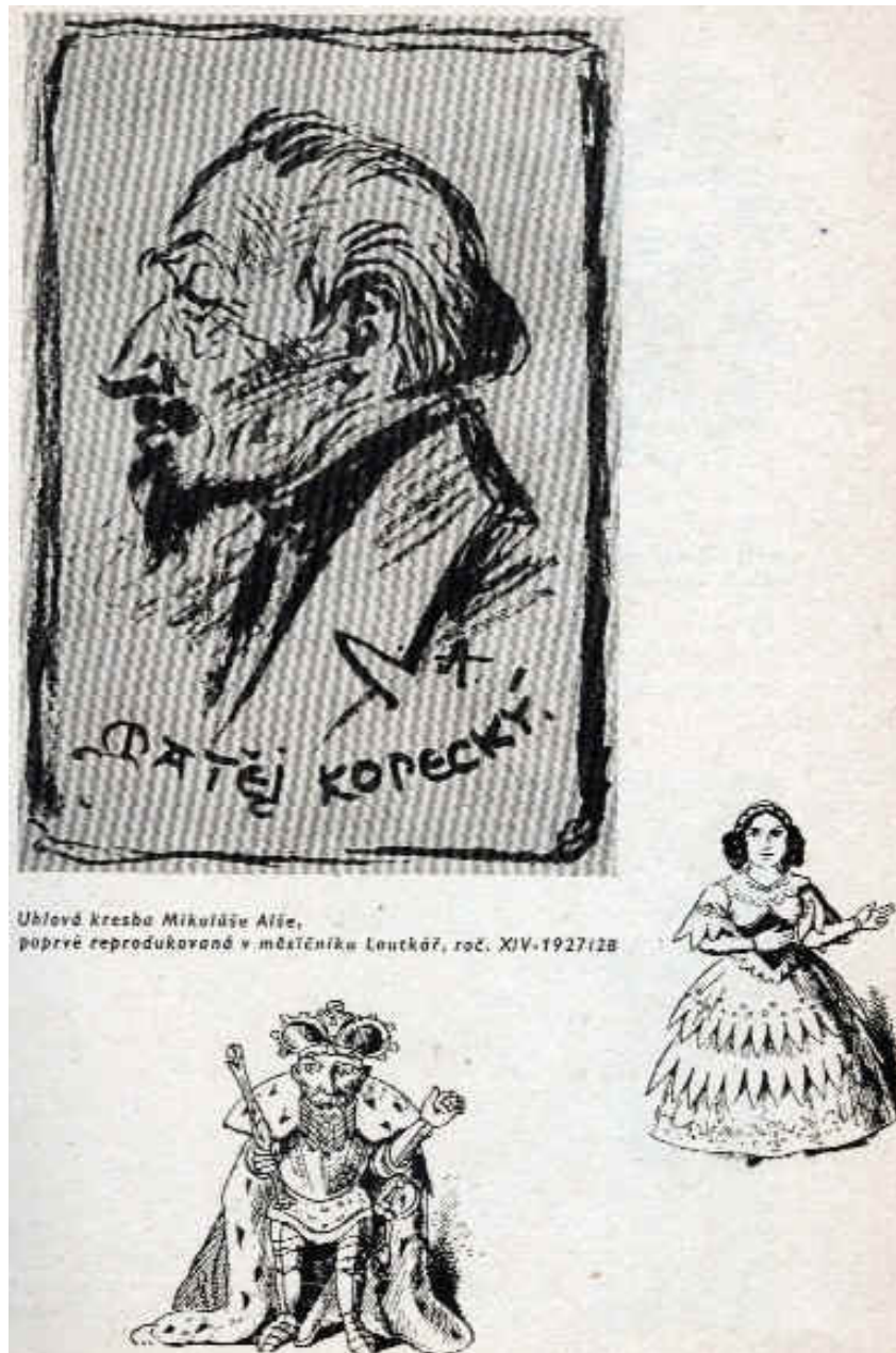
Uhlíková kresba Mikoláše Aleše, poprvé reprodukována v měsíčníku Loutkář, roč. XIV-1927/28

V našem archívu Alšových kreseb jsme totiž objevili jeho kresby z dosud nepublikované oblasti: