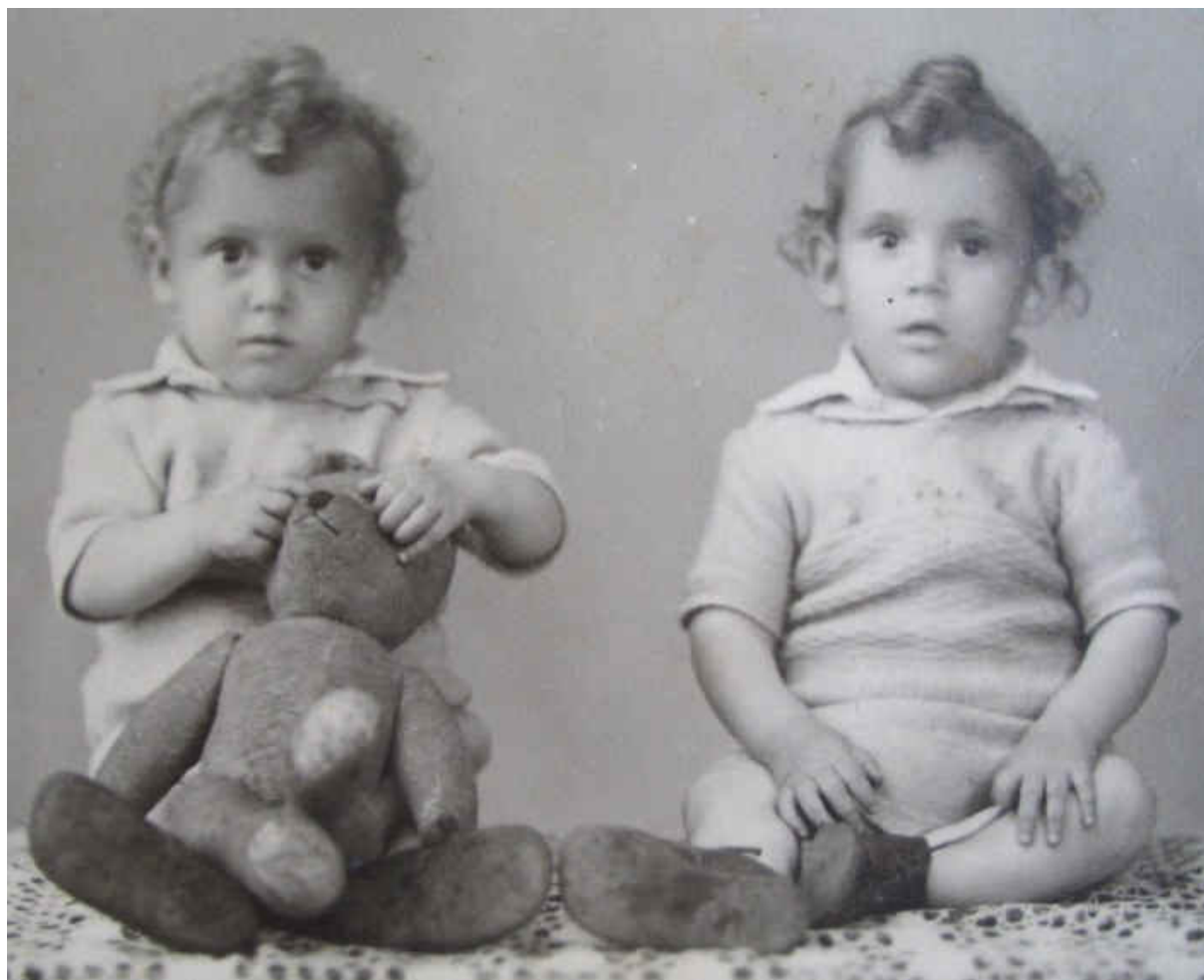
dvojčata v roce 1950