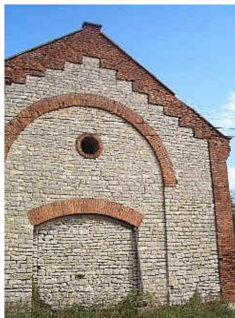
zadní štít statku v Málkově