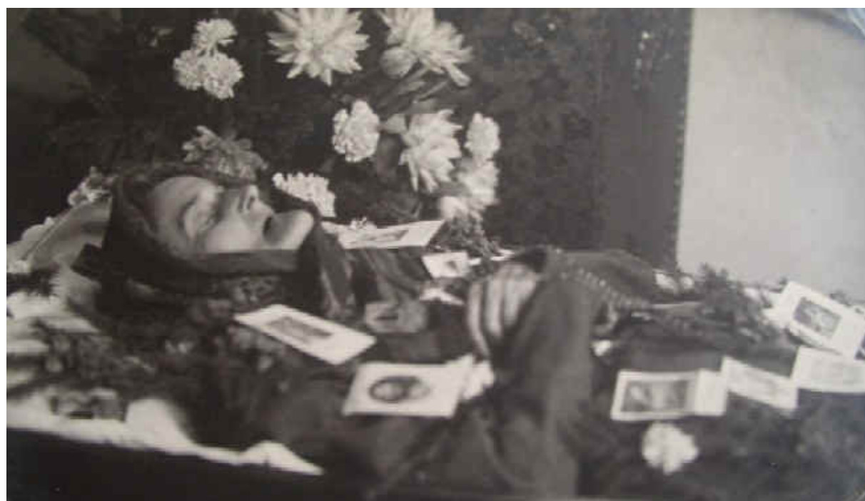
hubená maminka v rakvi v roce 1948