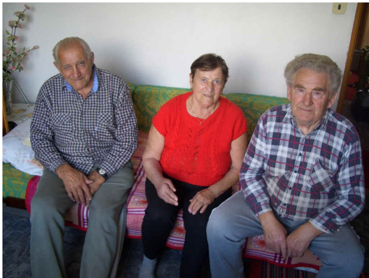
dnešní „vyhnaní“ v Točnicku